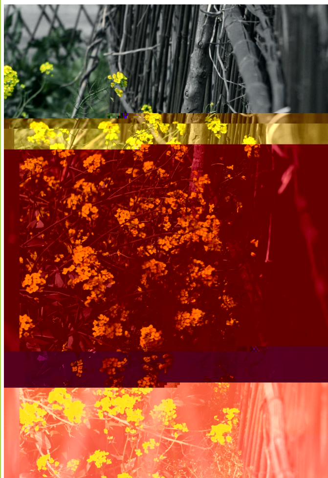
春天的脚步 袁和平 / L

1949年，莫X8Y切Af术得nZ[学 、8的界认为是[学上的e一大进步。上 50年，该方X广m用于]病^者。人 的大一个半分为>个，Y为中的一部分， 大约_1/3体积，所^者在切AY v以 如行a肉z bc听E。Dfs亡人，这@“好 的人”只是以d吸e了。由，联1到了H部 名的电影fg. h入院i。 该片的主人公j _算不上一个病^者，他 只是喜3@y经的事情。于是他在[院•一 e一地l /长的E，成为她的中m，是/ 长en切地1要bU;的他改造成一个“听E的人”。 /长是谁?/长是H@完美规T的/者，他 们见不得一点点的改e。j e是谁?他是自由的向 往者，他本[有#意，只是hh S多了，他1要 G1要1去。