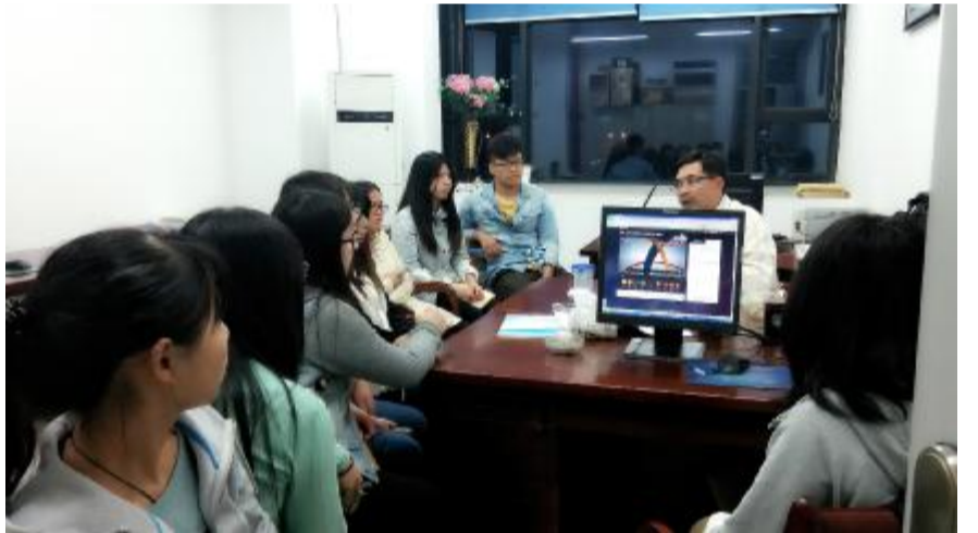
教师激励计划实施@A, 广大教师积极B实。C为教师DEFG HI / 摄

v W 骨干) G_` a b + 根; 落 脚d 是F q 更好@ z 6 = 生E 长E Q V 其> #) G 是关键环节# _` a b Y 是 I 通过N' ) G 待遇、完善制/ 设a " _` ) G 回归) 书* P; 原V = W \ 以 a b 支持F 基础、以} ~ f i F 抓手、 以考核评价F 手段、以制/ 建设F 根 ; # k 面整合) = I 素与资源# 构建良 好+ “) = 生态环境”# 最终i j 是I 牢