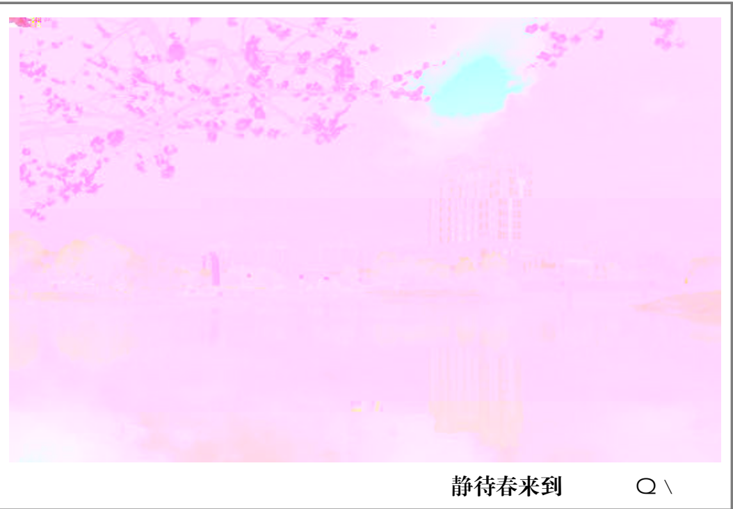
静待春来到 Q \

泰戈尔x :“只有 历过地 狱般的磨砺, 能练就 天$ 的力量;只有流过的, 指, 能 弹出世~的绝l 。” D的背后, 是- w的. 出与^力的j k。年 P 17%的“天 年”苏&' ] oE 一L4天, 一 #银,l \了观vp烈的) 呼与7声。i @耀c的天 与成] [ . 开c 苦与K奋, C-x 的训练量就能 ( 坏