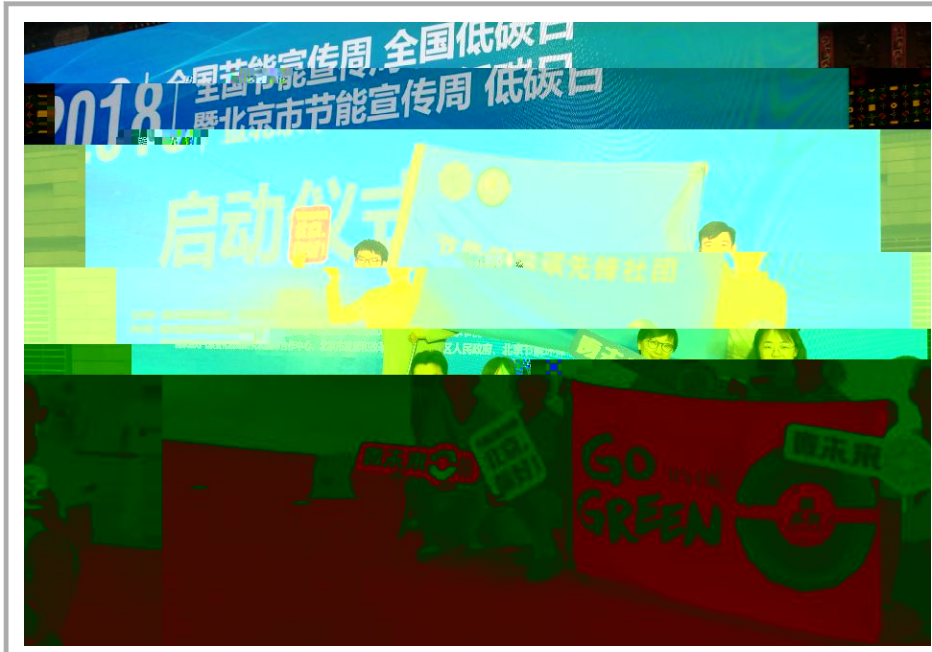
2018 年全国节能宣传周全国低碳日活动于6月11日启动,我校三位同学经市教委选派代表上海市“青未来联盟”参与活动。会后,我校学子接受了央视及相关媒体的采访。

p " dP 意9a : ; ) b 程O ; { 8 z l, F• 务cd {• 员 安 "VXPJ * Z ? "遵 { "CD { %G W" sd{ { M +, p 8X\ 网+Z A { { M +, 6 * ++ , +[# /8 ; +[ # 8 2018• ( ) l 员 8 *) b 程 O ; X, { ; J P +, +AYi 6 [员 "sA d { ; . e N# a (规划与政策法规研究室 供稿)