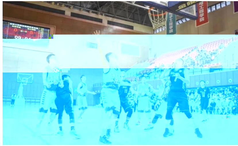
5月20日晚，作为我校传统体育赛事之一的“校园杯”篮球赛圆满落幕。经过激烈角逐，化工学院夺得本届篮球赛冠军，经管学院获亚军，城建学院和工创学院分获三、四名。(体教部供稿)

萱草种质资源库，学研度5合D沪滇生合|}7国脱贫攻坚\美丽中国建，了^“|}7~·怒州乡村振兴项目”将一技术X,由我校半照`团Z的LED}照`技术c最度突f|照{足缺，据植物定波.的|人补|照`，.N稳生目的一种多学科叉生}技术|}的,c^r}民脱贫，7扶贫(人事处供稿)