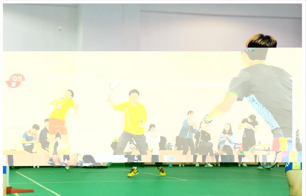
4 8 2017

tk%10 _ mt d $stu [! %B u中 \ 上 L B 中 U U_ 力$ 海市vw .第x' { % O立 B u中 rk; 技 技 y z A{ By d`a机c$ j $中 |[ ] ~d% B %; B u y " \任 Uu$t U ;K %&' " %() \任 C任• UK *+ # $