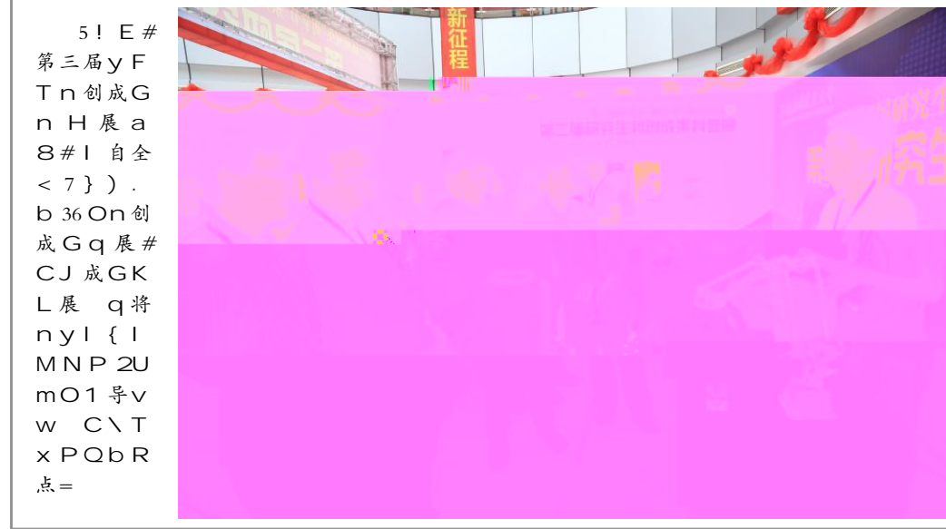
5! E # 第三屆yF Tn 创成G n H 展 a 8# I 自全 < 7 ) . b 36 On 创 成Gq 展# CJ 成GK L 展 q 将 ny I { I MNP 2U mO 1 导v w C \ T x PQ b R 点=

理FG 强 府 对 小 企 业HE 新 策指C 性 de 对区 整体HE 新mT 与fg 监 督 理w a ; 指C 国 小 企 业 选 择 适 宜 HE 新 模 式 与 策 de H E 新 绩 w ; O 小 企 业 HE 新 理 ? FG 与 企 业 践 I 海 建 设 具 球 影 响 力 I 贡 献 & 将 打 " 具 区 影 响 力 品 牌 智 库 A " 员 之 翟 明 告 诉 记 加 强 海 e 智 库 品 牌 建 设 d 升 海 e 智 库 影 响 力 海 市 委 近 期 启 2016 年 海 e 智 库 涵 建 设 小 企 业 HE 新 理 FG 基 + 海 I 角 它 入 选 \ 于 步 de 涵 力 建 设 @ 会 影 响 力 增 强 国 海 过 程 贡 献 影 响 力