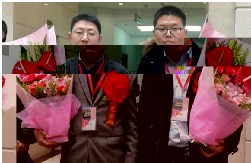
Two men holding bouquets, likely at a conference or ceremony.

！ " 3 " 1 # 8 # & ! ' 分别B# 234! 56789: 交流q, - ] ' ) ( * WO- . Pt u & 对 C! D 认真做好 789: 56 提W? 求] . ' ) = > ? / 4- . ] s 海, ! 1 少沪4 授 / s 海海洋, ! 7 宗恩4 授应邀参LV 导i 9] ( * ! 听{ @Aq, a` K & 分别就C ! D@关56 < % i 9P 提W了明确? 求] ( * j 调&2次234! 56789: & 是对* ' 整Zp! X Ra 又一次综合 Z 检"] * ' s 下都? n + > 视&C! D(1! ? < - 一步厘清p! o 路/凝练p! 特色/找准发展 短板&L X 秀X * ' NOY [ m % \ ] Ra n 水h 应用技术, ! 发展基础] = > ? ! - s ? 求C! D? 通过此次 q, 交流&deo 考! DI XI 9N56 cd` 4 育4! 改革中面baz 迫问U & P 就A 续做好下一阶段9N56 < % 了布置] 与- 专家对C! Dq, 过v 中存! a 问U < % 了详细i 9 分析c V 导&专家们 希望&C! DI 整个789: 过v 中? 处 处服x! ' , 局/处处呼应! ' 整Zp! 定位c o 路/处处展y! ' 人才培养特色& 始终坚4 目标导向c 问U 导向&充分展现 234! 过v 中a 特色亮i c 典型做法] ! 两天K 间里&C! D(1! z z | } 234! 56789: a @ 关Z 系? 求& 就2! D(1! a @ A < % 了认真q, c 展 y]