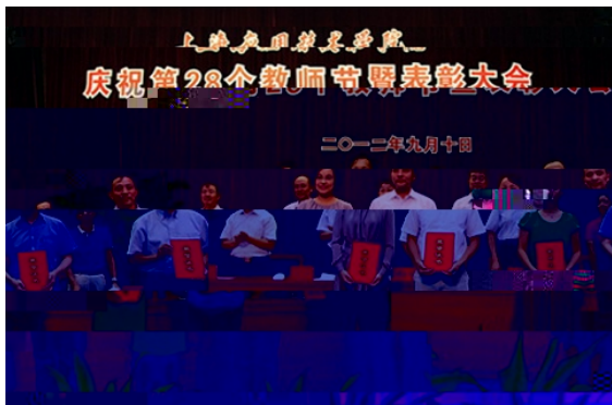
校长奖获得者风采

本报讯!"#bc*9 10 & ' H HTUH *VWOXYZ [\ MI. ]^ (名单见四版) BH/O`3ab cde fgh i j kMI mn op (详见二版报道) qrs@ mtu vw xy Oz{| },+~·Y 5/ wxy / @wxy / p u t Tw / 5/O 9 Y },+~·m t