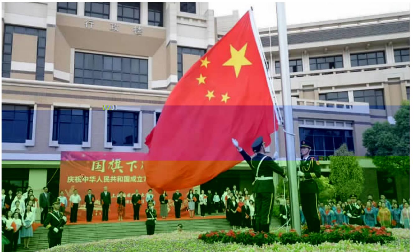
本报讯(通讯员 周雄才)为 70 为 10月1

8 70 800 信念 志求真务 努力 作 习 积极投身 时 特色 社 主义 践 做 为 先锋 量 为 增辉 为 添彩 为 增!